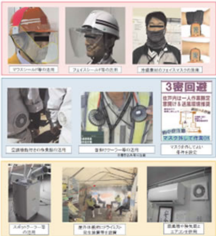
熱中症リスク軽減等のための取組事例(国交省資料)

国土交通省は、7月1日に「建設業における新型コロナウイルス感染症予防対策ガイドライン」を改訂し、現場の熱中症リスクを軽減する対策を追加しました。熱中症リスク軽減に効果のある空調機能が付いた作業服、冷感素材のマスク、スポットクーラーの設置などの事例を拡充。屋外で人と十分に距離を確保できる場合は、マスクを着用しないことも現場で周知することとしました。 ガイドラインは、建設現場やオフィスで3密を回避するための基本的な感染予防対策を整理したもので5月14日に策定されました。今回、感染予 防策にともなう熱中症リスク軽減のため、各現場で行っている熱中症予防事例が追加されました。具体的には、体温上昇を回避するためにマスク着用に関してマウスシールドやフェースシールド、冷感素材のマスク、空調機能がある作業服、首掛けクーラーなどの活用を紹介。現場や休憩所に関してはスポットクーラーや扇風機、ドライミスト発生装置の設置、屋外作業の現場では送風機での通気性確保、テント付きの休憩所設置などが示されています。 また、少なくとも2人以上の人と人の距離を確保できる場合は、マスクを外すことも推奨しました。