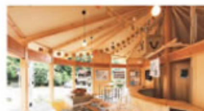
内子町産のヒノキの大黒柱

2021年2月末まで開催中の道後アートの交流拠点「ひろみつジャナイ基地」が6月20日に松山市道後に完成しました。