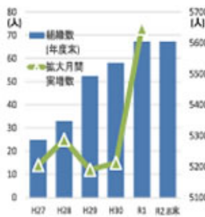
平成27~令和2年度拡大月間実増数と年度末組織数の推移

【組織対策部】令和2年度の組織拡大月間が9月1日から始まります。 例年、現場訪問や組合員宅訪問、イベント会場での呼びかけなどを行い、拡大運動に取り組みましたが、今年度は新型コロナウイルス感染症予防のため対面での会話などが難しくなっています。 各支部で感染防止対策に取り組みながら、できる範囲での組織拡大運動を行っていきます。 令和1年度は、544人の仲間が新たに加わり、組織数は69人増加しました。