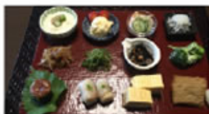
地元野菜などを使った朝食

1階の朝食会場から中庭の廊下を進むとお風呂場。中庭はモミジなどが植えられ季節により表情が変わります。建物への入口は正面廊から入り、隠れ家の雰囲気も感じることが出来ます。