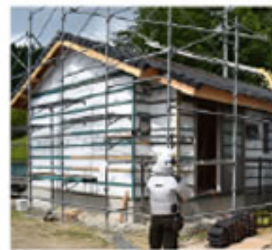
工事が進む仮設木造住宅

住宅が活躍しています。熊本現場には7月末時点で18県連組合から290人の全国の仲間が就労予定です。