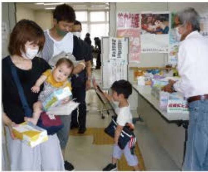
拡大グッズを手渡し未加入者の紹介を呼びかける=伊予支部

【組織対策部】令和2年度の1年間に429人の仲間が新たに加わり、組合員数が6人減少し7年連続での年間増勢とはなりませんでした。また、秋の組織拡大月間では83人の仲間が新たに加わり組織数は4人増え7年連続の増加となりました。