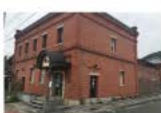
風格ある外観を今も残す

おおず赤煉瓦館は、120年前の明治34年12月に大洲商業銀行として建築されました。当時では珍しい外壁に赤煉瓦、イギリス積みみの煉瓦建築で、屋根には和瓦を葺き、鬼瓦に商の字を入れた和洋折衷の様式が特徴です。大正11年に銀行としての役目を終え警察庁舎等を経て平成3年に現在のおおず赤煉瓦館として再出発しました。平成3年には大洲市有形文化財に指定されるのなど歴史的価値のある建物としても認識されています。 現在は風格ある外観をそのまま生かし、観光施設として活用され、1階で伝統工芸品などの販売、2階は休憩所として開かれています。休憩所に置かれているレジスターは木製で時代を感じる品で建物だけでなく彩るアイテムにも注目です。 また敷地内の一角には錆びた自転車や長い時代を経たレンガなど、明治や大正、昭和と刻んできた時代を感じる事ができます。