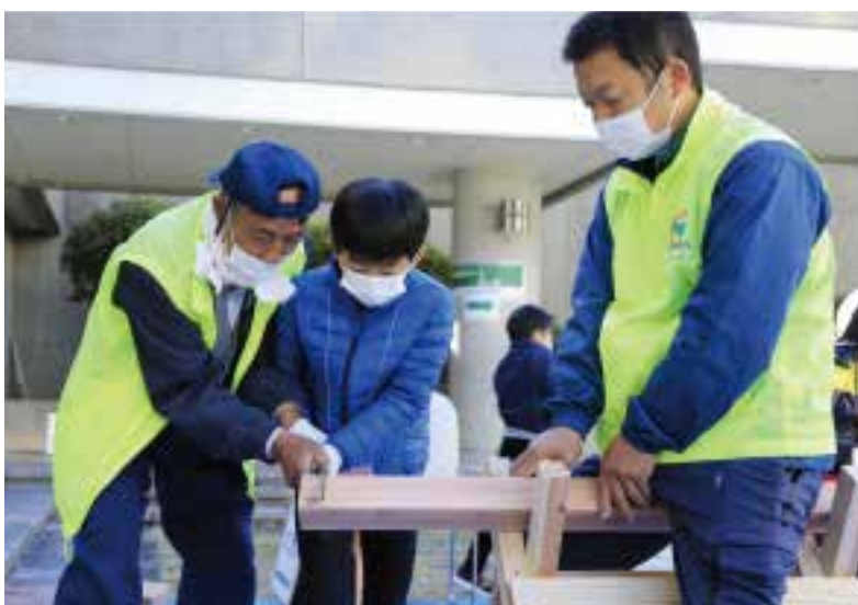
大工道具を使つての体験に仕事の大切さが分かる発見があった

組合員数の動向 加入者 20人 脱退者 37人 前月比▲17人 1月末現在 5,594人