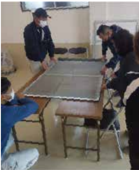
網戸の張替えなど細かいところまでスッキリと

【越智 孝・宇摩・住対 部長・大工・60歳】12月 12日午前8時から、宇摩 支部会館にて第44回住宅 デーを行いました。 組合員、主婦の会合わ ど細部まで行いました。