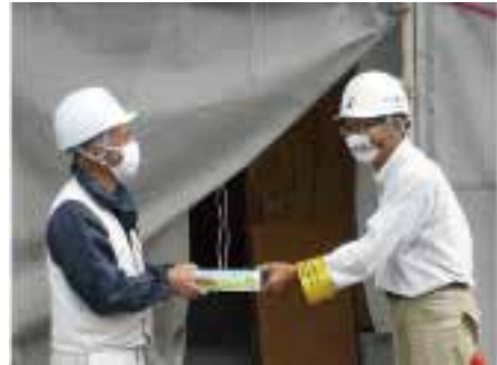
ティッシュ手渡し拡大の協力を求める

【玉岡 義規・伊予・ 一】11月16日労対部の安 働条件が厳しいよう で 組織部長・大工・66歳 全パトロールに同行し ます。