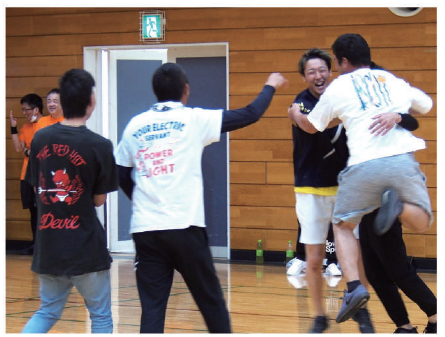
大事な場面で得点し喜びを爆発させる全居浜

第13回AI-KENソフトバレーボール大会を9月24日(日)伊予市民体育館で4年ぶりに開催しました。今年度もエヒメ健診協会を加えた10支部17チームが出場。試合は3ブロックの総当たり戦で、各ブロック上位2チームが決勝トーナメントへ進出。各チーム間の親睦と交流を交えながらも、白熱した試合が展開され北条支部が3大会連続10度目の優勝を果たしました。