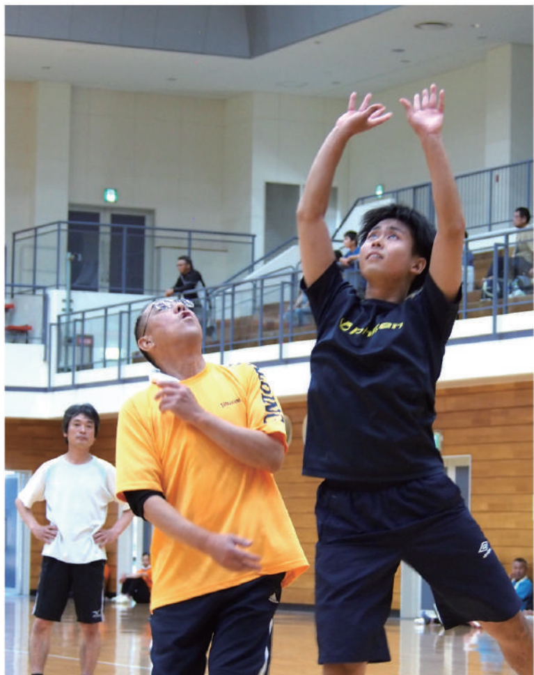
決勝戦で松山北Aチームと対戦した北条チーム