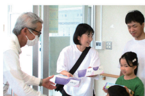
ティッシュ箱を手渡す

3日目は仕上がった紙面を教室ごとに発表。各講師の考え方が反映された紙面となりました。