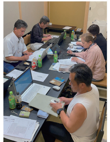
分散教室で記事を作成する受講生

金額や工期だけでなく純粋にモノづくりの楽しさを次世代に継承することで組織拡大につながっていくと思います。