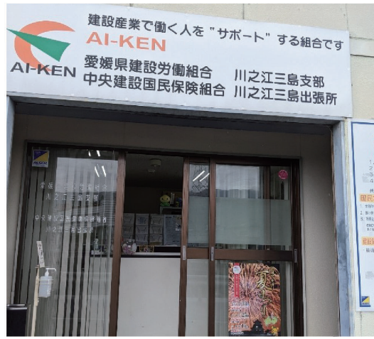
ベテラン、若手組合員の意見や助言に耳を傾ける窓口

川之江三島支部のある四国中央市は愛媛県の東の端に位置し、四 国山地と瀬戸内海に挟まれた地域です。2004年に川之江市、伊予三島市、土居町、新宮村が合併して今年で20年となりました。 紙・パルプ、紙加工品の製造品の出荷額等が全国1位の紙の町で7月には紙祭りや書道パフォーマンス甲子園が開催され全国から選ばれた高校書道部多数参加し、大判の和紙に音楽やダンスを取り入れた書道パフォーマンスをして作品を完成させます。興味のある方はぜひ一度お越しください。 川之江三島支部は昨年35周年を迎え現在組合員数は約260名。組織数の大幅な増減はありませんが組合員の高齢化が進んでおり今年度は後期高齢者への移行者がこれまでで一番多く5年後、10年後の組合員の減少が懸念されます。 現在のところは支部長をはじめ若い役員が多く青年部も活発に活動しております。 組合活動やイベントでは健康体力づくり教室のウォーキングとバーベキューが好評で若い組合員さんが多く参加くださり賑やかに開催しています。 これから先、組合員の人数の維持、拡大ができるよう、ベテラン、若手の組合員の意見や助言に耳を傾けてより良い魅力ある組合になるよう努力してまいります。