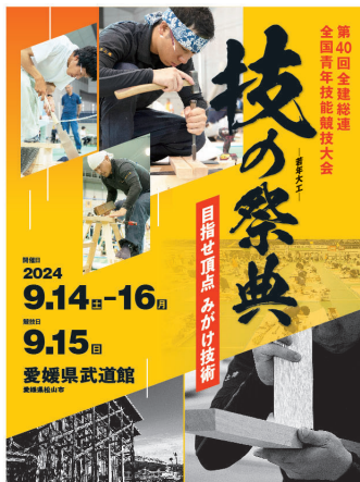
愛媛で開催される大会ポスター

金額や工期だけでなく純粋にモノづくりの楽しさを次世代に継承することで組織拡大につながっていくと思います。