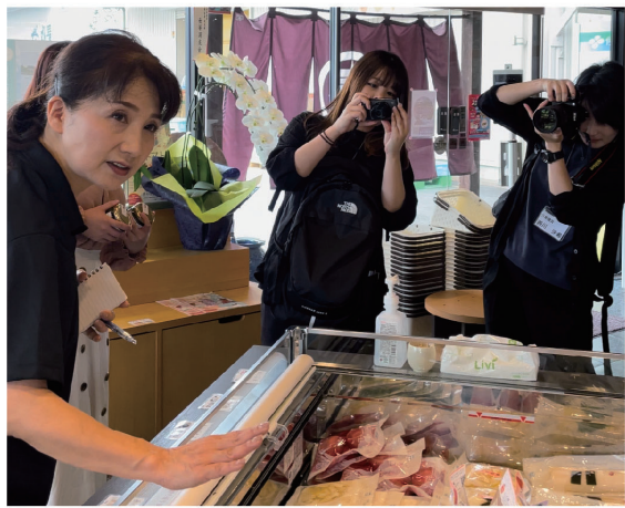
取材に応じる店員(左)と良い表情の瞬間切り取る受講生