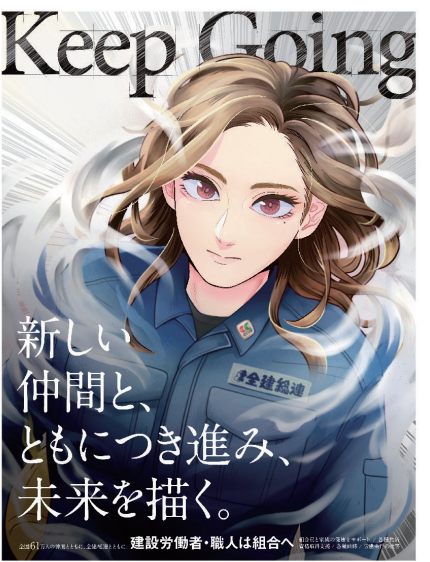
全建総連作成のポスター

今回のポスターは、様々な困難にも負けず、仲間と結束し逆風に立ち向かう女性を描いた、力強さ溢れるビジュアルとなりました。建設従事者の減少、後期高齢者医療制度への移行に伴う脱退など様々な困難に立ち向かい、仲間との顔の見える繋がりを強化する為、秋の拡大月間はKeep Going(前進し続ける)していきます。