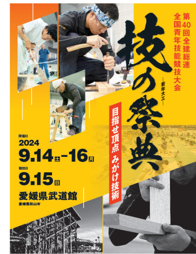
全建総連作成のポスター

8月中旬には競技大会の動画を見ながら当日の流れや、気を付けるポイント、昨年の結果と照らし合わせながら競技へのイメージを膨らませました。