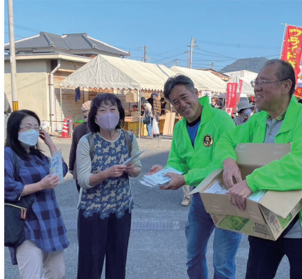
昨年の拡大月間中の様子 イベント会場でチラシを配布 (北条支部)

【組織対策部】今年度も秋の組織拡大月間が9月1日から始まります。秋の組織拡大行動が4月