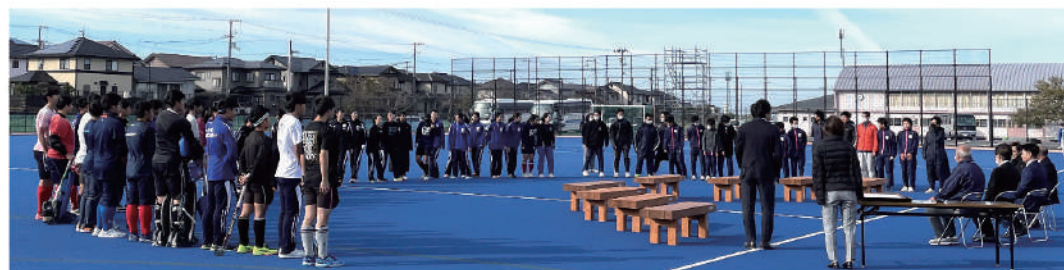
式典に集まったホッケー選手約50人の中高生からも感謝の言葉をもらう＝松前町

愛媛県代表の中学生ら約50名が、新しいベンチを見て感謝の言葉を伝えてくれました。2016年5月に完成したホッケー場は、年間1万5000人以上が