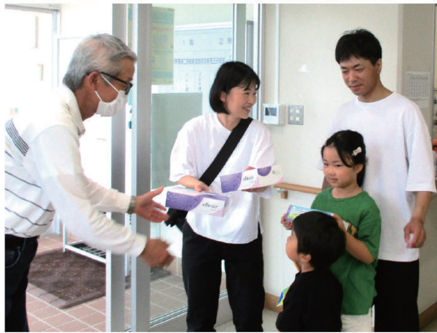
拡大グッズ手渡し未加入者紹介を依頼(伊予支部)