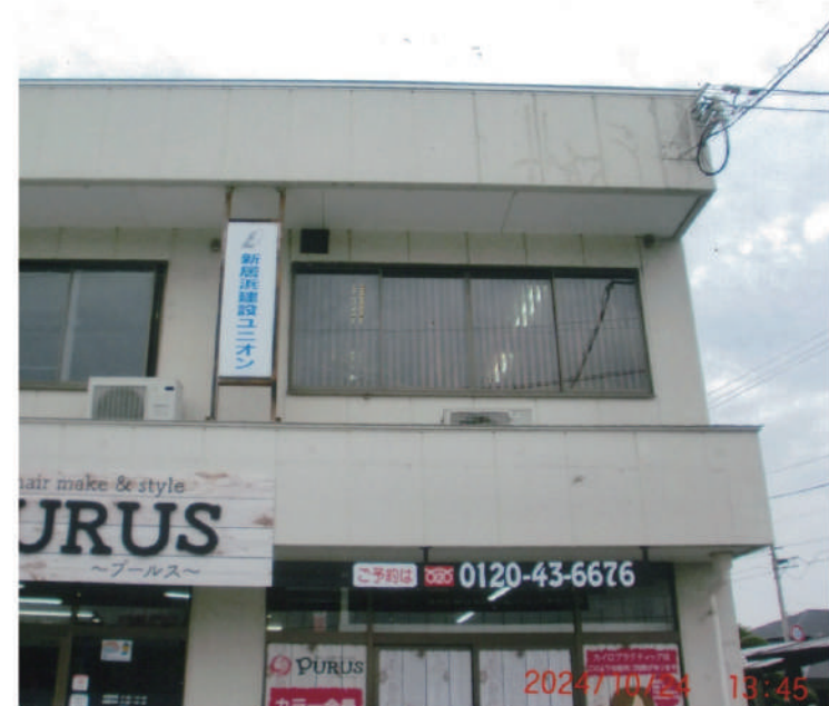
地元で親しまれる組合を目指し頑張る

83人となりました。現在住宅デー運動では公共団体の地域交流センターと協賛し秋の文化祭イベントで木工教室を開催しました。イベントには消防署や高専学校、PTA、婦人会、地区青年団などもブースを設け多くの方が来場しました。ものづくり体験として小学生を対象に30組以上の木工製品作りを