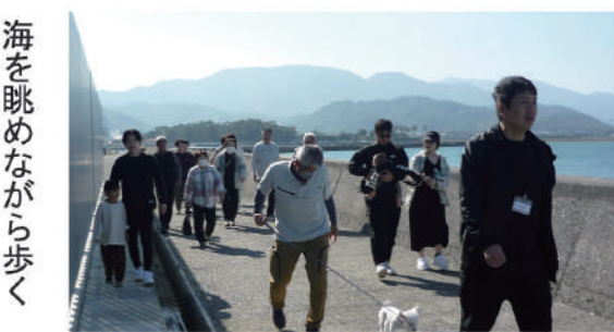
海を眺めながら歩く

ました。雨が降る午前8時に組合事務所をバスで出発。当初の予定では今治湯ノ浦ICを降り糸山公園江津準備体操。来島海峡大橋6・5kmをウォーキングで渡る予定でした。当日は警報が発令されるほどの大雨で、予定の変更を余儀なくされました。