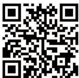
全建総連特設サイト

の成果である、労働者の処遇改善を盛り込んだ法律「第三次・改正担い手3法」への理解を広げるために、全建総連が見やすいリーフレットを作成