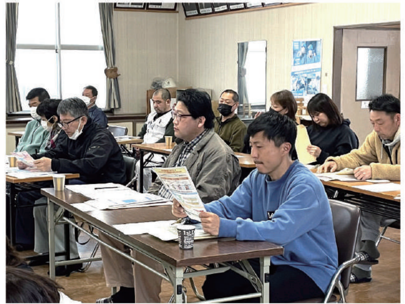
マイナ証の紐づけ状況により渡される書類が変わる事などを学ぶ

なお有効期限が切れた保険証はご自身で破棄することが可能です。※保険証をご自身で破棄する場合には裁断など行い、個人情報漏れのないよう管理に十分お気を付けください。